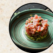
Tartare de saumon