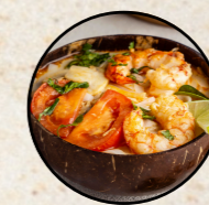
Colombo de crevette