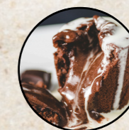
Fondant au chocolat