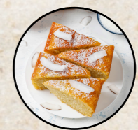
Moelleux coco ananas